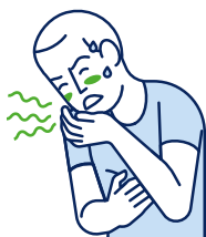
Vertiges / Nausées