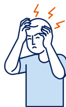
Maux de tête